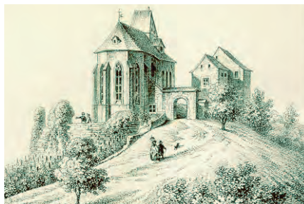
Chrischona-Kirche um 1845