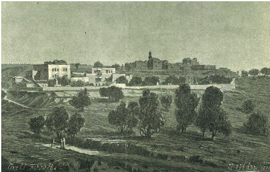
Diözesanschule "Gobat-Schule" auf dem Zionsberg in Jerusalem